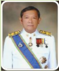
ปลัดจังหวัดสุราษฎร์ธานี (กรรมการ)