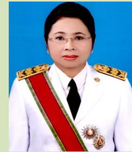
ชนารักษ์พื้นที่สุราษฎร์ธานี (กรรมการและเลขาฯ)