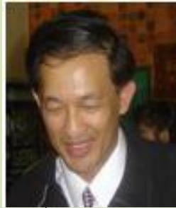
กรรมการพื้นที่สุราษฎร์ธานี (กรรมการ)